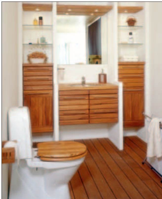
Her er vist det eksklusive og maritime Skagen massive teak gulv med gummifuge.

For yderligere information og vejledning omkring lægning af Skagen Skibsplankegulve med gummifuge henvises til Danwo A/S på tlf. 75 14 20 44.